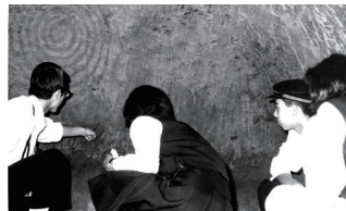
清戸迫76号横穴墓の調査

昭和20年代から双葉地方の地域史研究に大きな足跡を残してきた県立双葉高校史学部。企画展では、同校史学部の部室に保管されていた考古資料や、民話・空襲被害の聞き取り調査記録などの貴重な資料を展示しています。