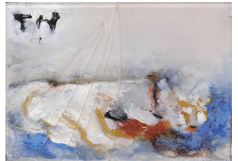
「ねこ」(制作年不詳) 河野保雄コレクション

「放浪の天才」や「日本のゴッホ」とよばれた洋画家・長谷川利行。約120点の作品から辿る魂の軌跡は、改めて「絵画とは何か」問いかけています。ぜひご来場ください。