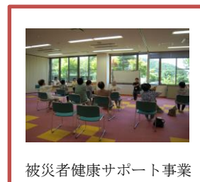
被災者健康サポート事業