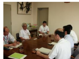
医療機関訪問の様子