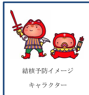
結核予防イメージ キャラクター