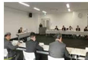
ケアシステム構築推進会議