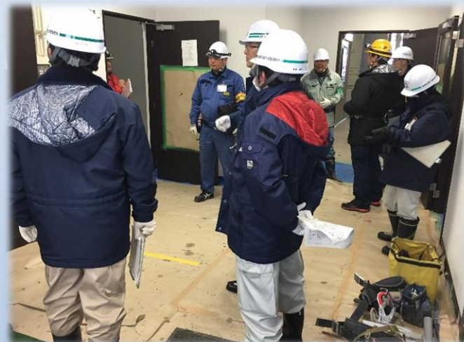
資材等の整理整頓、床面保護の点検状況