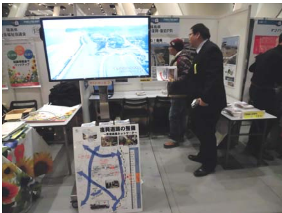
【土木部ブース全景です。】