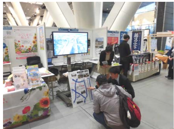
【復旧・復興概要等の説明状況です。】