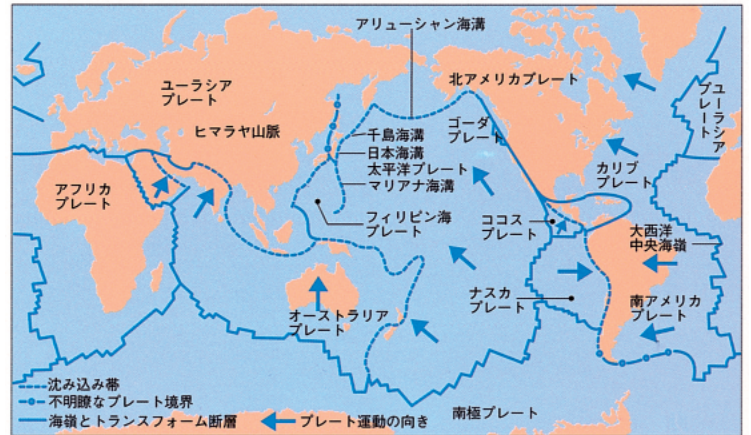
上2つの図は、科学技術庁(1996)「日本の地震」より