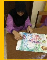
海をイメージしてペタペタ