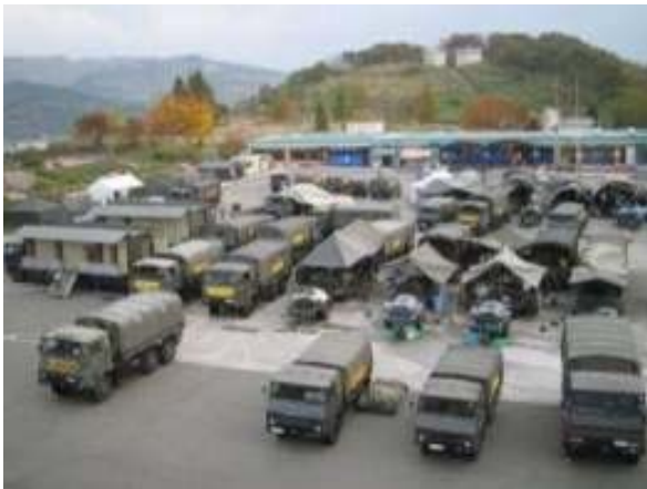
防災拠点としてのサービスエリア、パーキングエリアの使用