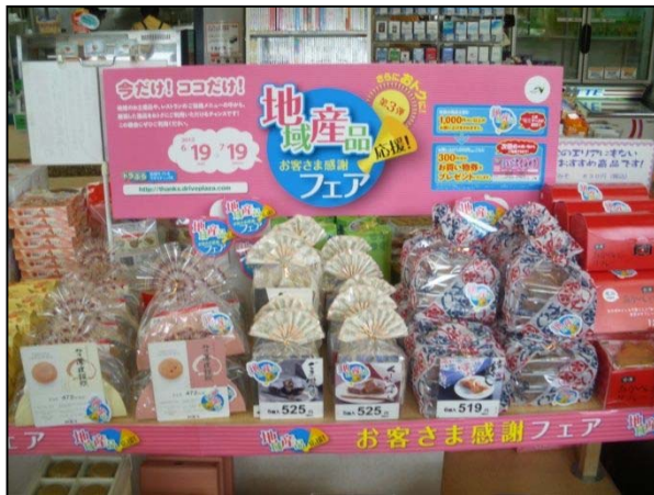
地域産品応援お客さま感謝フェア 【福島松川PA(上り線)】