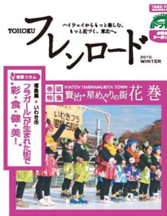
東北6県を紹介する 季刊誌『フレロード』