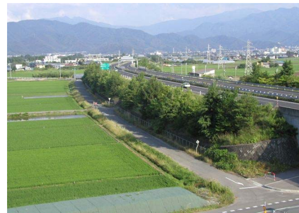
高速道路法面の樹林化