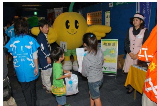
海ほたるでの イベント風景