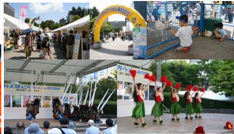
ハイウェイコミュニケーションin東北 東北6県の観光、文化、食などを一堂に集めて紹介