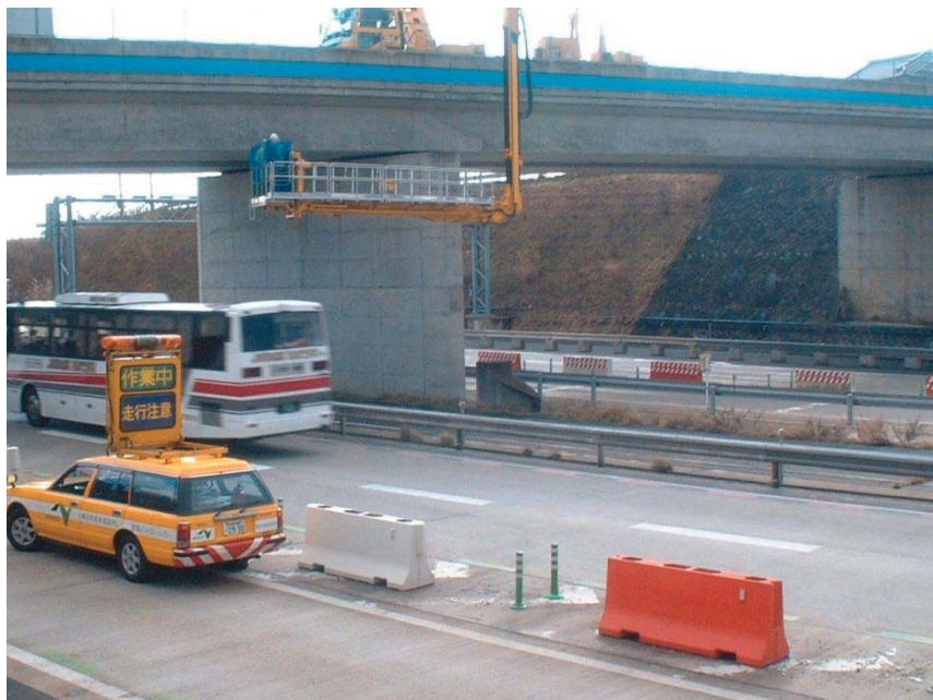
橋梁点検車による点検