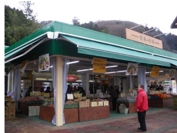
県内産の野菜・米・果物等を販売する「E-NEXCO野菜市場」 【国見SA(下り線)】