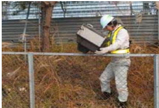
不法投棄物の回収