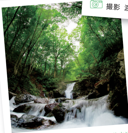
二本松市 あだたら溪谷 奥岳自然遊歩道