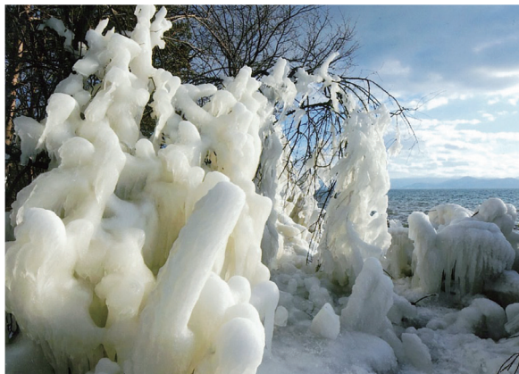
猪苗代町 猪苗代湖天神浜のしぶき氷