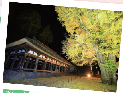
喜多方市 新宮熊野神社 長床