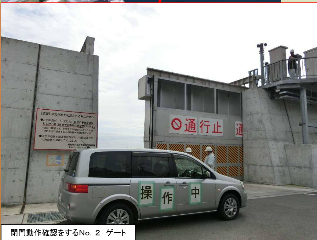
閉門動作確認をするNo. 2 ゲート