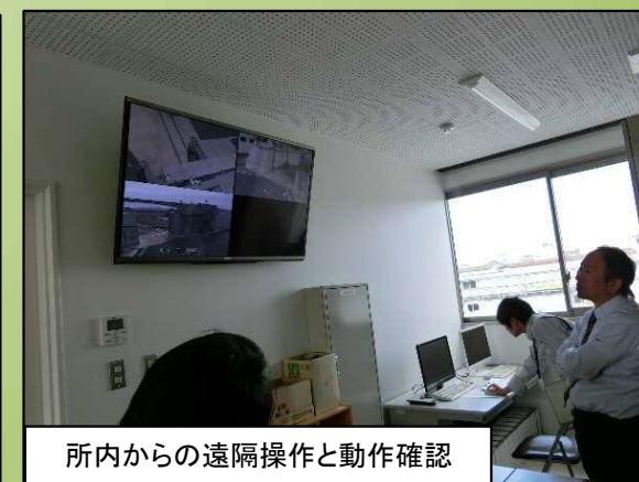
所内からの遠隔操作と動作確認