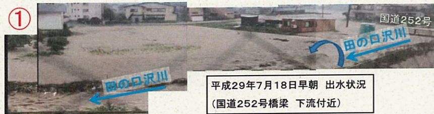
平成29年7月18日早朝 出水状況 (国道252号橋梁 下流付近)