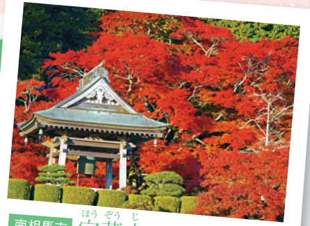
南相馬市 ほうぞうじ 宝蔵寺