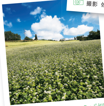
喜多方市 山都町一郷のそば畑