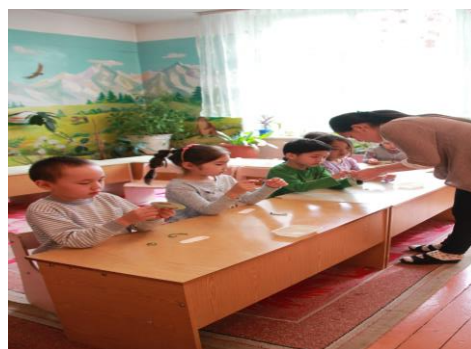
図画工作の授業の様子

みんなドレスやジャケットなどを着て、歌を歌ったり、ダンスを踊ったりしてお祝いします。