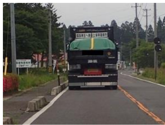
一般道路の輸送状況確認