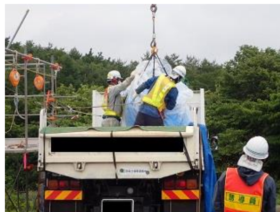
除去土壌等の積み込み作業確認