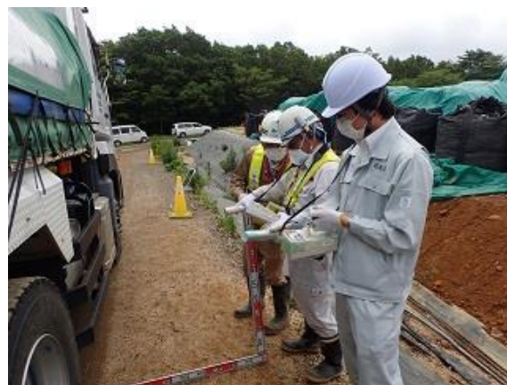
輸送車両の空間線量率測定