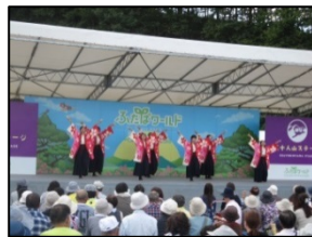
ふたばワールド2016 in かつらお (葛尾村村民グラウンド)