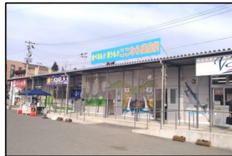
ココなら商店街（楢葉町）

その他、主要道路沿線ではコンビニエンスストアなども営業しておりますので、トイレを利用する際は、お店の方に御確認の上御利用ください。