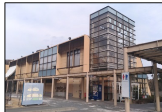
道の駅ならば(檜葉町)

同じく、国道6号線沿いの浪江町の「まち・なみ・まるしえ」、富岡町の「さくらモールとみおか」、広野町の「ひろのてらす」、檜葉町の「ここなら商店街」や、国道399号線沿いの川内村の「YO-TASHI(よーたし)」