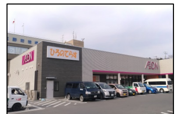
ひろのてらす(広野町)