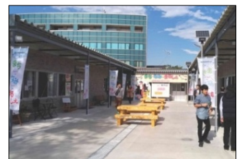
まち・なみ・まるしえ(浪江町)