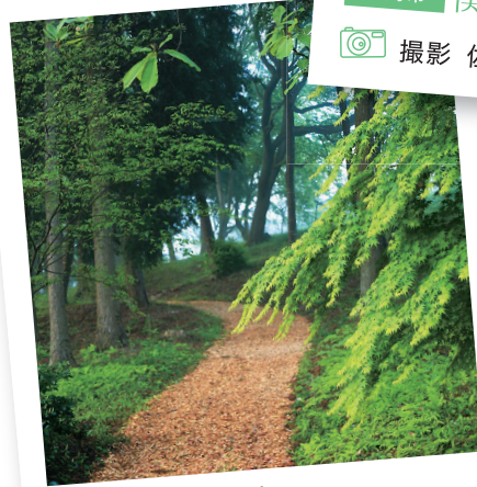
中島村 「童里夢公園」わきの 図書館散歩道