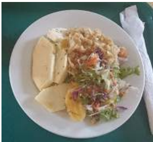
↑ カリブの代表的料理