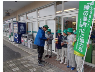
緑の募金街頭キャンペーン(南会津町)

今年度につきましても「未来へと植えて育てる緑の輪」を運動テーマとして、豊かなふるさと再生や豊かな森林を次世代へと引き継いでいくための活動を推進して参りますので、ご協力をお願いします。