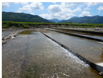
復旧した新田堰 (南会津町藤生)

平成27年9月の関東・東北豪雨により館岩川、伊南川、阿賀川が氾濫し、大きな被害を受けた農地・農業用施設は、南会津町と下郷町合せて269箇所、被害額13億円に上りました。