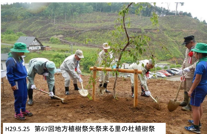
H29.5.25 第67回地方植樹祭矢祭来る里の杜植樹祭