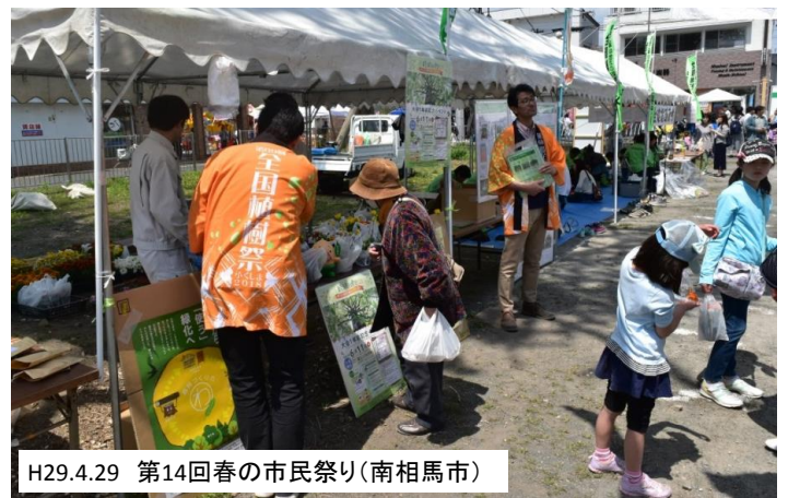
H29.4.29 第14回春の市民祭り(南相馬市)