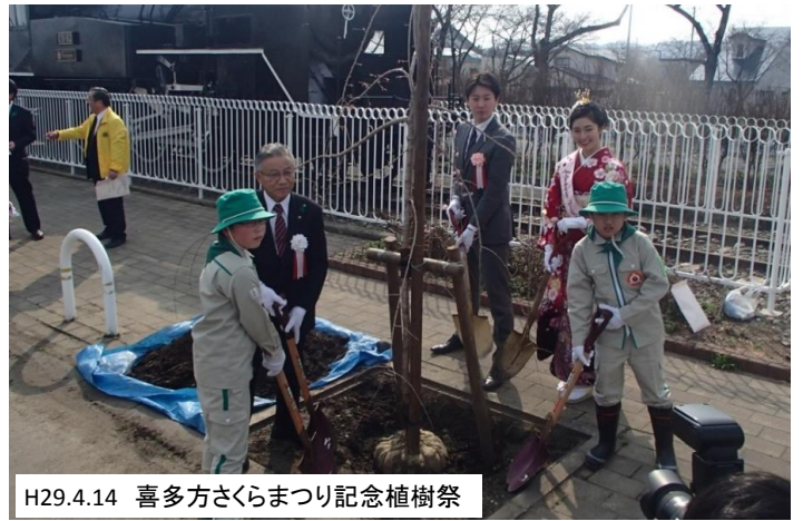
H29.4.14 喜多方さくらまつり記念植樹祭