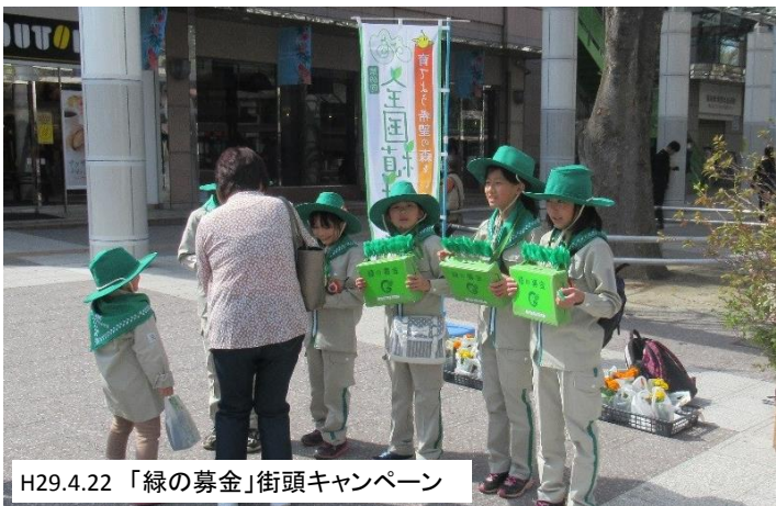
H29.4.22 「緑の募金」街頭キャンペーン