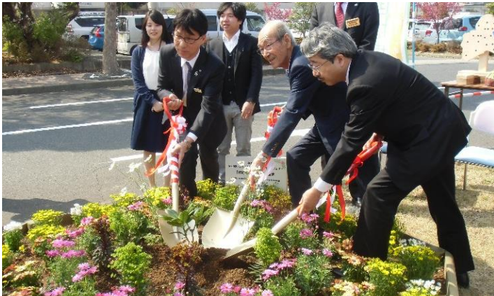
花いっぱい県民運動50周年記念「花と緑いっぱいのふるさとづくりプロジェクト」