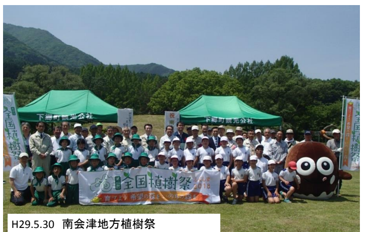
H29.5.30 南会津地方植樹祭