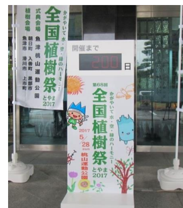
富山大会カウントダウンボード