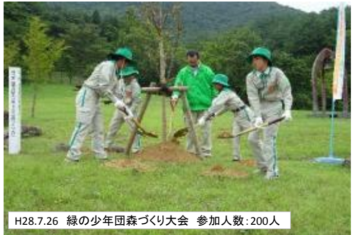
H28.7.26 緑の少年団森づくり大会 参加人数:200人