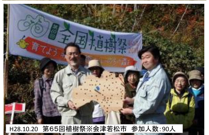
H28.10.20 第65回植樹祭※会津若松市 参加人数:90人