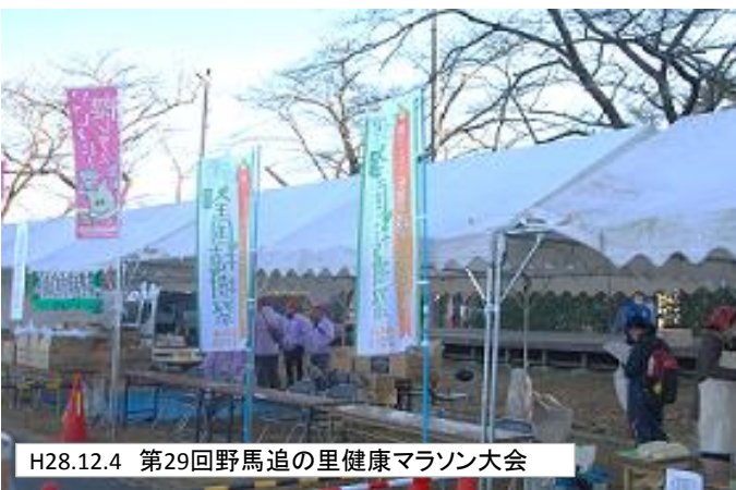
H28.12.4 第29回野馬追の里健康マラソン大会