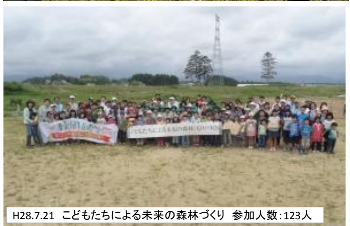
H28.7.21 子どもたちによる未来の森林づくり 参加人数:123人