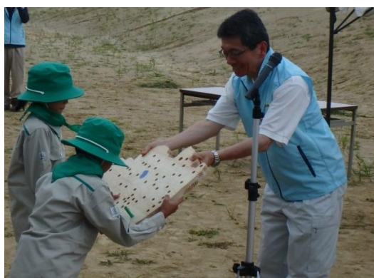
(子供たちによる未来の森林(もり)づくり)