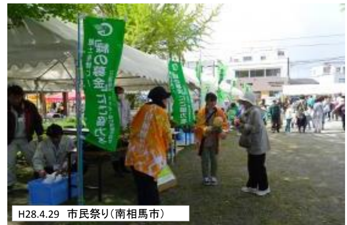
H28.4.29 市民祭り(南相馬市)