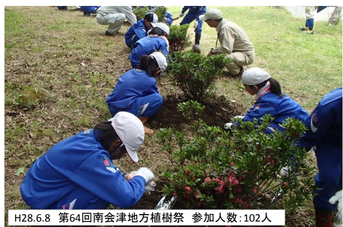
H28.6.8 第64回南会津地方植樹祭 参加人数:102人