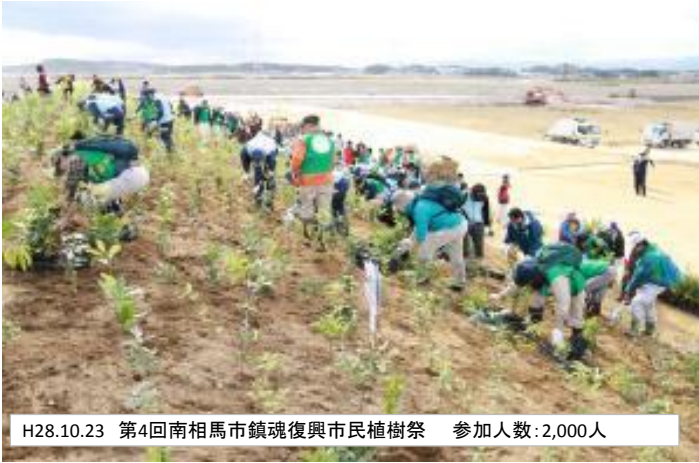
H28.10.23 第4回南相馬市鎮魂復興市民植樹祭 参加人数:2,000人