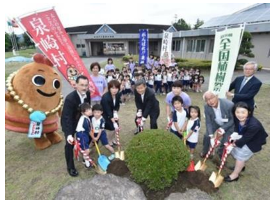
(ふるさと大好き59市町村応援プロジェクト)