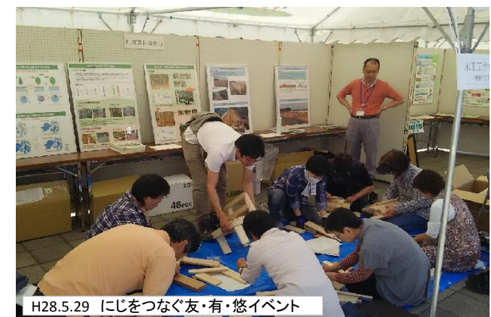
H28.5.29 にじをつなぐ友・有・悠イベント