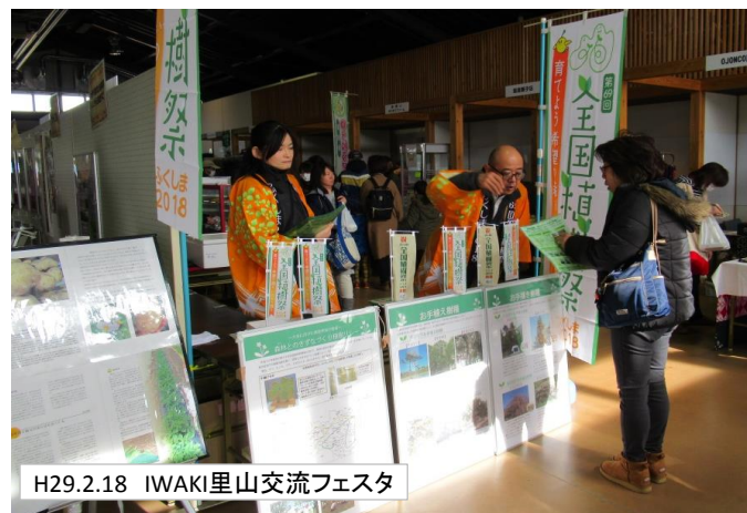
H29.2.18 IWAKI里山交流フェスタ