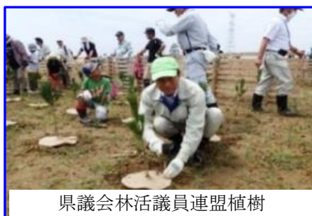
県議会林活議員連盟植樹