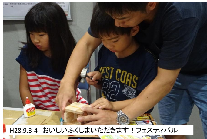
H28.9.3-4 おいしいふくしまいただきます！フェスティバル