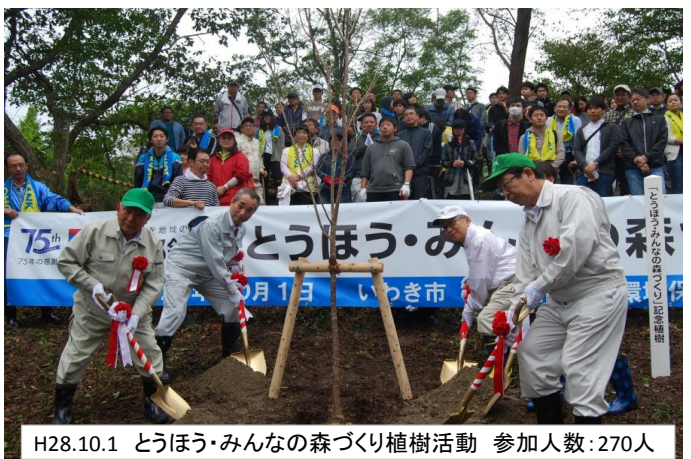
H28.10.1 とうほう・みんなの森づくり植樹活動 参加人数:270人