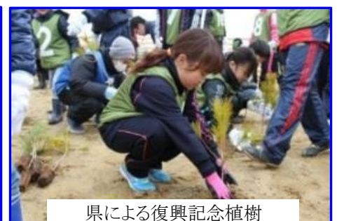
県による復興記念植樹