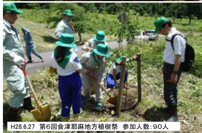
H28.6.27 第6回会津耶麻地方植樹祭 参加人数:90人