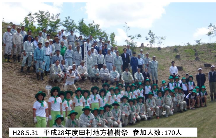
H28.5.31 平成28年度田村地方植樹祭 参加人数:170人