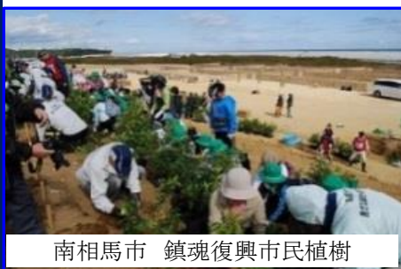
南相馬市 鎮魂復興市民植樹