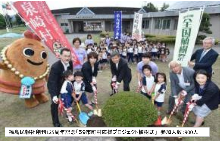
福島民報社創刊125周年記念「59市町村応援プロジェクト植樹式」参加人数:900人