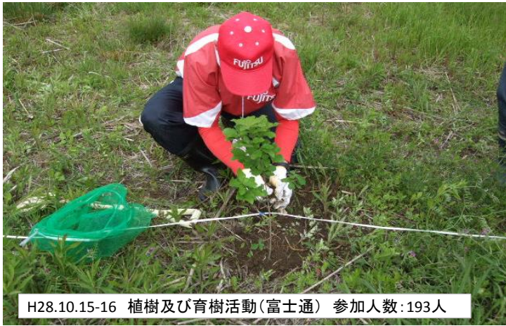
H28.10.15-16 植樹及び育樹活動(富士通) 参加人数:193人