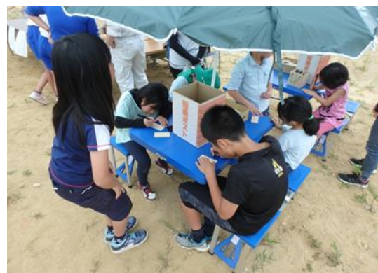
(木製短冊に森林(もり)づくりへの想いを記入)