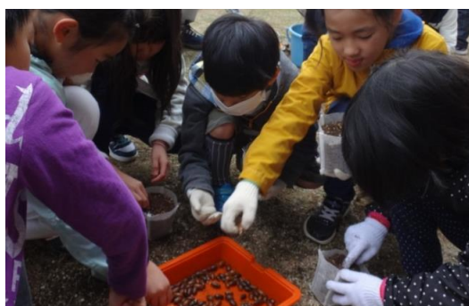
(郡山市立多田野小学校)