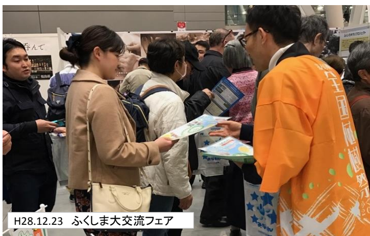
H28.12.23 ふくしま大交流フェア