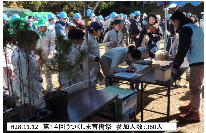
H28.11.12 第14回うつくしま育樹祭 参加人数:360人