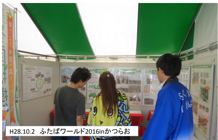
H28.10.2 ふたばワールド2016inかつらお