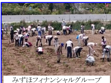
みずほフィナンシャルグループ