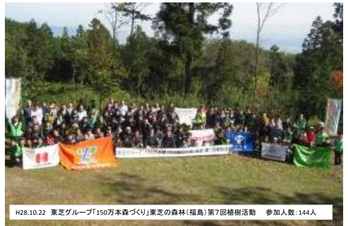
H28.10.22 東芝グループ「150万本森づくり」東芝の森林(福島)第7回植樹活動 参加人数:144人