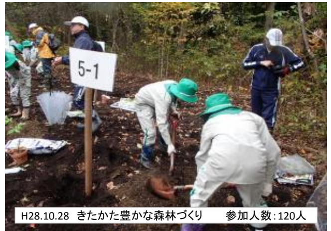
H28.10.28 きたかた豊かな森林づくり 参加人数:120人