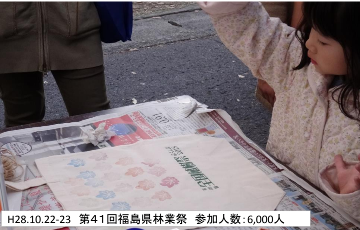
H28.10.22-23 第41回福島県林業祭 参加人数:6,000人