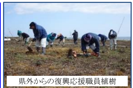
県外からの復興応援職員植樹