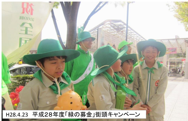
H28.4.23 平成28年度「緑の募金」街頭キャンペーン