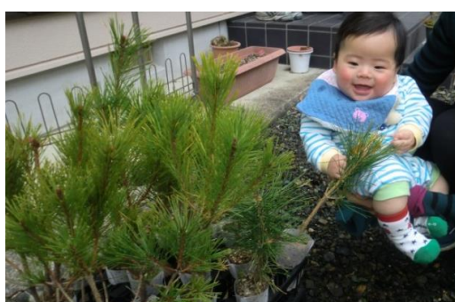
(家庭での取組状況)