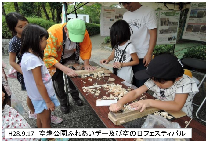
H28.9.17 空港公園ふれあいデー及び空の日フェスティバル