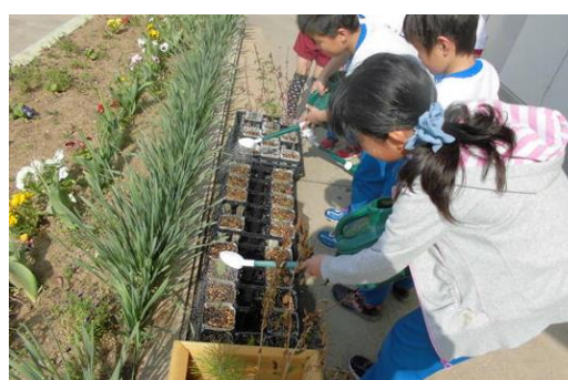
(相馬市立八幡小学校)