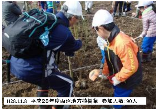
H28.11.8 平成28年度両沼地方植樹祭 参加人数:90人