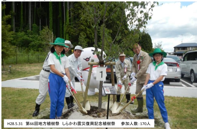
H28.5.31 第66回地方植樹祭 しらかわ震災復興記念植樹祭 参加人数:170人