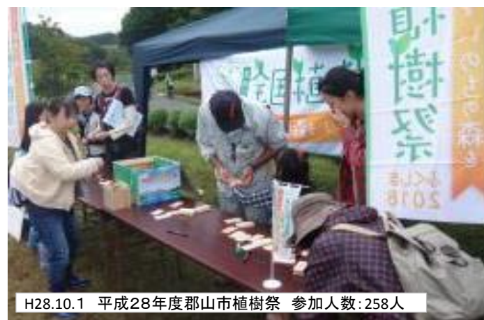
H28.10.1 平成28年度郡山市植樹祭 参加人数:258人