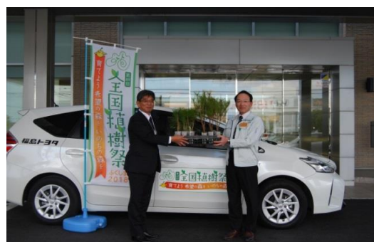
(苗木のホームステイ・引渡しセレモニー)