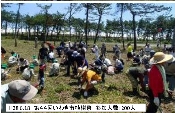
H28.6.18 第44回いわき市植樹祭 参加人数:200人