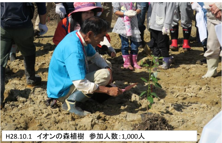
H28.10.1 イオンの森植樹 参加人数:1,000人