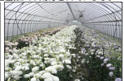
開花期のトルコギキョウ