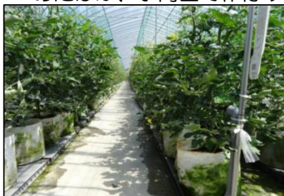
ミニトマトの養液栽培

トルコギキョウ ：震災後、南相馬市で栽培者が増えています。今年度4名の方が新たに栽培を始めたほか、小高区で作付け再開の動きもあり、今後さらなる生産拡大が期待されています。