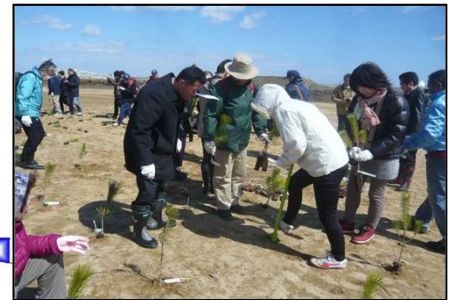
祈念植樹(クロマツ苗)状況