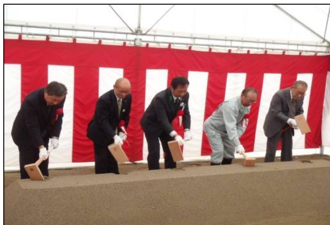
安全祈願祭の様子

工事概要：整地工A=318.4ha、 用水路工(パンプライ)L=33.9km、 排水路工L=50.2km、 道路工L=41.4km、暗渠排水、客土工等