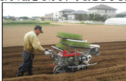
ねぎの機械定植作業