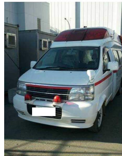
当社所有の救急車 周辺監視区域のフェンスの内外に 各2台(計4台)配備