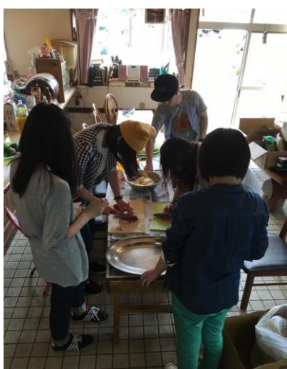
バーベキュー準備様子