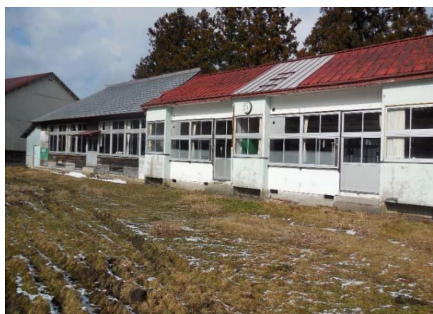
写真2：廃校になった原小学校