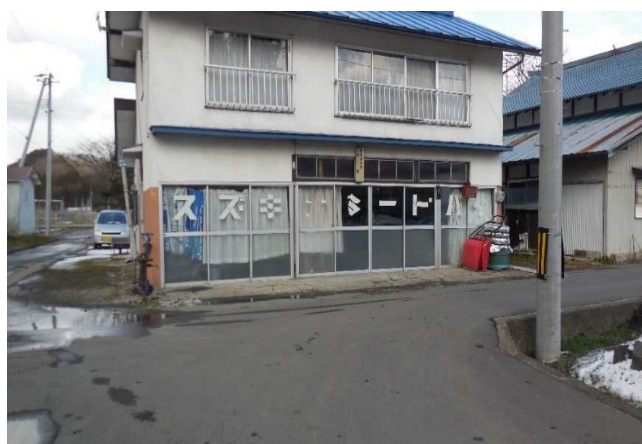
写真3：廃業した自転車屋さん