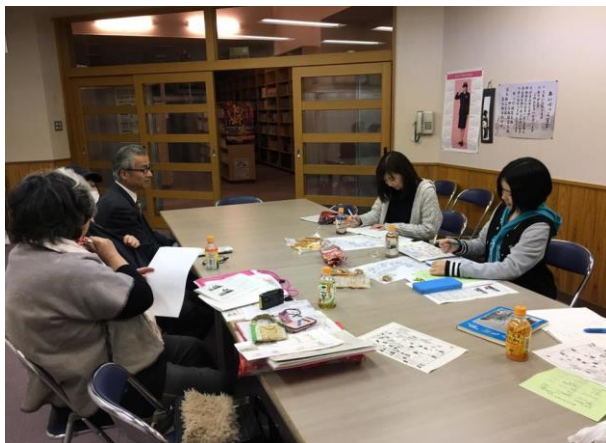
モニター事業打ち合わせの様子