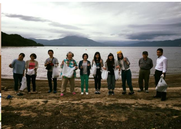
バーベキューの後のゴミ拾いの様子