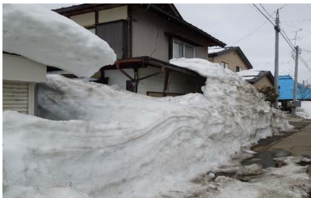
写真1：湊地区の冬の様子

湊地区は県内有数の豪雪地帯である。住民からは、「除雪ができなくなると住めない」、「年金暮らしでの暖房費は高負担である」、「冬期間は豪雪と強風で車が通行できない状態にあり不安」といった意見が出されている。また、人口減少の影響を受け、小学校が統合するなどしている。さらに地区内の商店はコンビニが一軒営業するのみである。