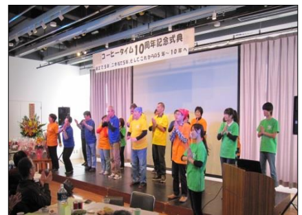
10周年記念式典 二本松市民交流センターにて

現在、コーヒータイトムは、二本松駅前二本松市民交流センター内のカフェ「コーヒータイトム」と、主に委託作業をする「若宮事務所」で活動しています。