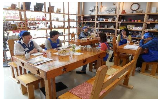
二本松市民交流センター内1階

若宮事務所では、「ボールペンの糸巻、軸検品」「縫製」「シール貼り」「箱折り」等の委託作業、さき織コースター、ストラップ等の自主製品の製造、昨年からは施設外就労として「アパート清掃」も始めました。「ボールペンの糸巻、軸検品」は、作業を始めて3年ほどになりますが、今では、メンバーがそれぞれのパーツを担当して、1日に100本ほど仕上げることができるようになりました。また、ワークショップの依頼も多く、メンバーが出かけて行き、「ボールペンの糸巻」を通して、皆さんと交流する機会も多くなりました。他にも、ボールペンの仕事に限らず、発注先から確かな仕事が認められ、それに伴って注文も増え、自信を持って作業ができるようになってきました。