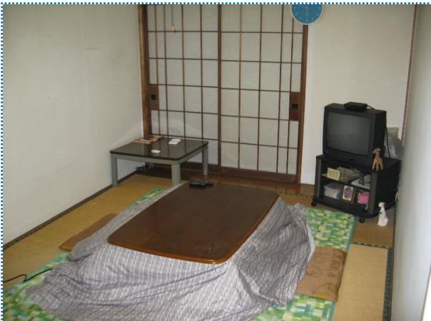
↑それぞれのお部屋はこのような感じですが、 皆さんがこんなにきれいなわけではありません(笑)