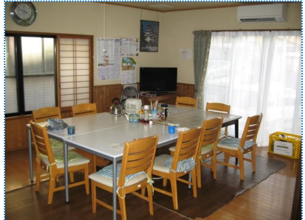
↑1人の時間も大切ですし、皆と食堂で一緒に 過ごす時間もよいものです。