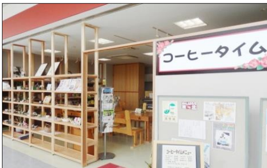
カフェ「コーヒータイトム」

カフェ「コーヒータイトム」では、「夢いっぱいの手作り作品が並んだレンタルボックス」の運営、浪江焼そば、お菓子の販売、美味しいコーヒーとケーキ、軽食を提供しています。カフェでは、若宮事務所とは違って接客が主な仕事になりますが、コーヒータイトムサービス、販売会等を通して地域の方々との交流も増え、二本松の「コーヒータイトム」として活動できるようになってきたと思っています。