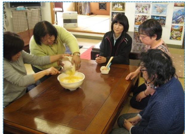
↑日中の活動として、地域活動支援センターの 茶話会に利用者さんが参加している様子です。