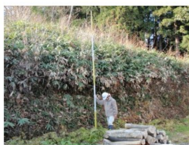
土砂災害が発生するおそれがある土地の区域の把握