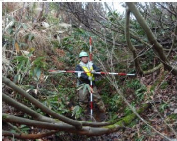
地形の状況に関する調査