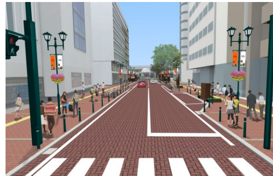
市道交差点から福島駅を望む