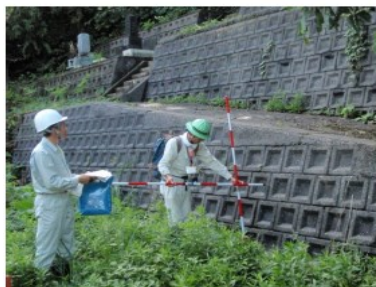
施設の設置状況に関する調査