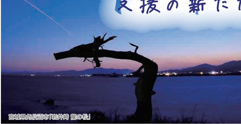
宮城県気仙沼市「岩井崎 龍の松」