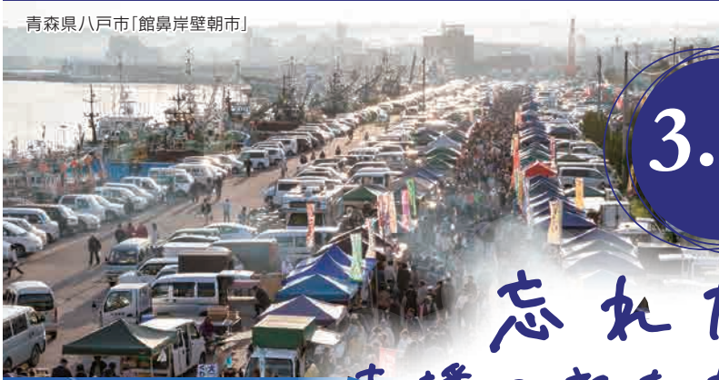
青森県八戸市「館鼻岸壁朝市」