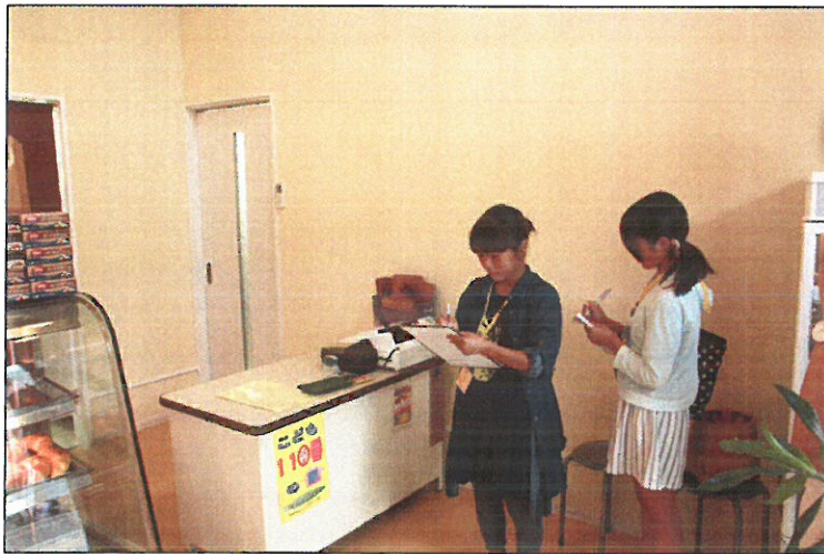
「越後屋」・・・町のパン屋さん。名物はカステラとロールケーキ。 子どもたちがそれぞれ聞きたいことを、お店の人に質問していました。