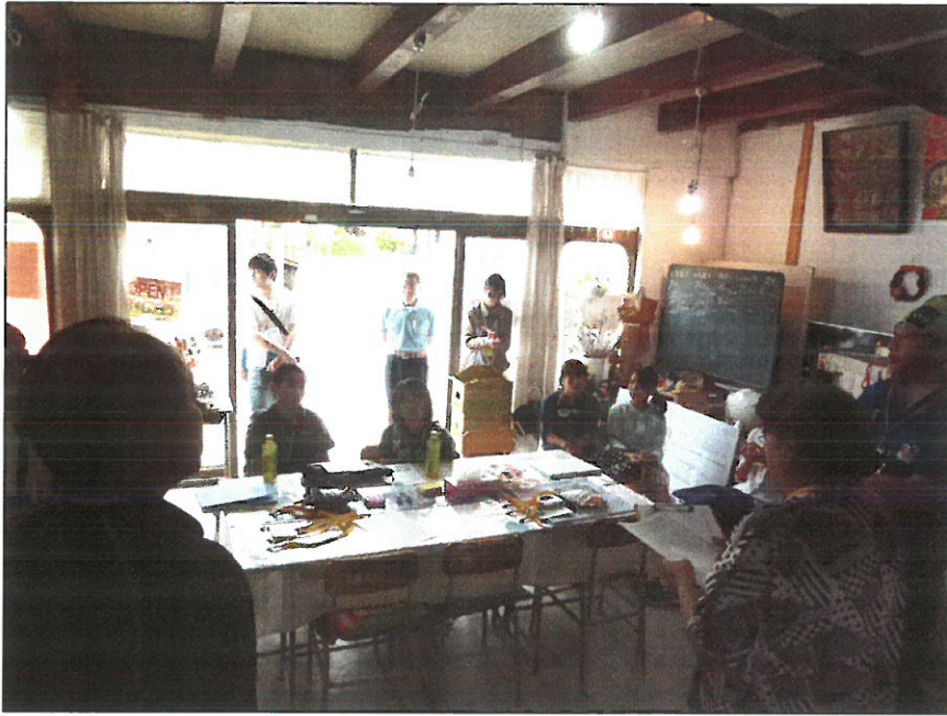
【第3回ワークショップ】 多目的スペース「はいり やんせ」において今回のワ ークショップ内容の説明