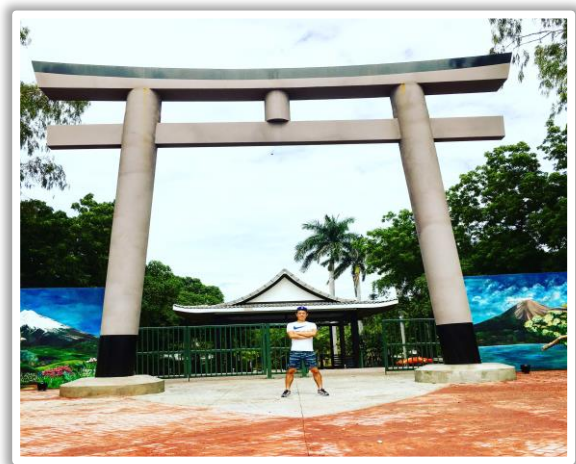
ニカラグアにある日本人公園