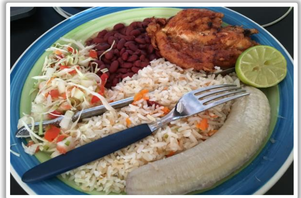
一般的なニカラグアの食事（米、豆、鶏肉、甘くないバナナ、野菜少し）

ニカラグア野球はすごく人気のスポーツで、現在世界ランク16位という上位にいます。しかし、指導者不足や道具を買うのにお金が必要のため年々野球人口が減っている現状を何とかしたい、野球を通じて次世代のリーダーを育成したいと要請がありました。