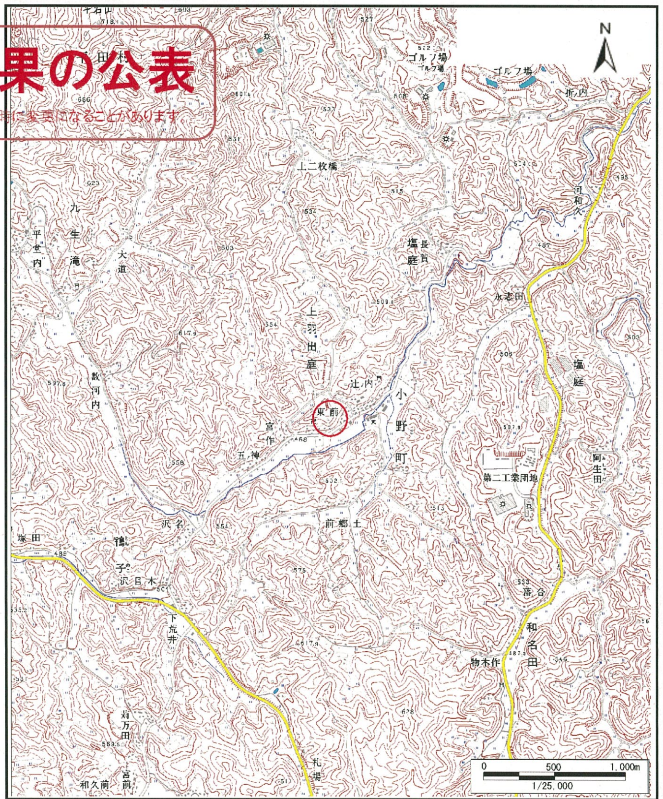
様式-1(急) 土砂災害警戒区域・土砂災害特別警戒区域 位置図