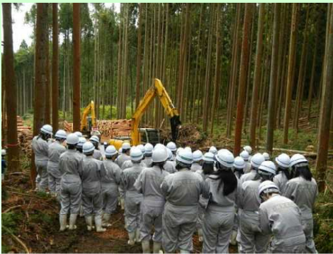
最新鋭機械での造材作業に見入る 白河実業高校の生徒

10月13日(木)、林業分野への新規就業者の確保に向け、高校生を対象とした林業現場見学会を開催し、福島県立白河実業高等学校農業科の1年生40名が参加しました。