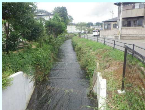
水路整備・西郷南部地区の工事始点

農村整備部では、農業生産基盤の整備、農村の防災力や農村生活環境の向上を目的とした事業を実施しています。