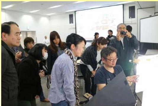
講師（写真右側、座っている男性）から撮影時の注意点について説明を聞く参加者

また、講師のレクチャーを受けながら、参加者自らが持参した商品を、本格的な撮影セットを用いて撮影しました。参加者からは「すぐ実践できそう」、「自分の撮ってきた写真の直すところがあった」など、前向きな言葉をいただきました。（企画部）