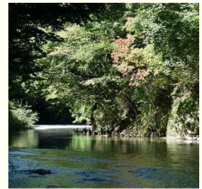
西郷澗 (西白河郡西郷村)