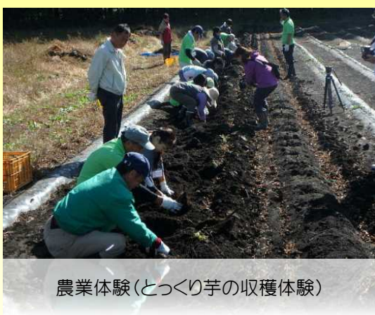
農業体験(とっくり芋の収穫体験)

10月26日(水)、西郷村において、しらかわ広域連携グリーン・ツーリズム推進協議会主催の「農業体験実践研修」が開催され、県南地方グリーン・ツーリズム実践者19名が参加しました。本研修では、受入技術の向上を目的に、「農業体験」と「救命救急講習」が行われました。