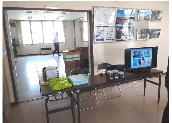
JFEエンジニアリング株式会社