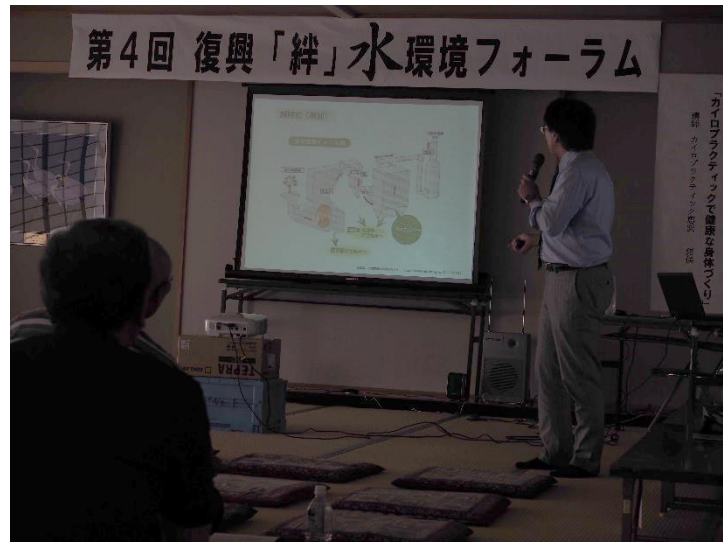
放射線に関する講演会（講演の様子）