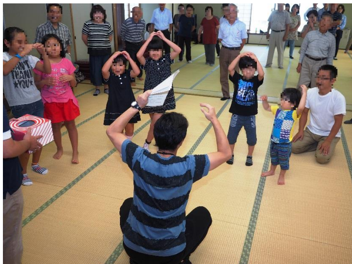
水環境(下水道)クイズ