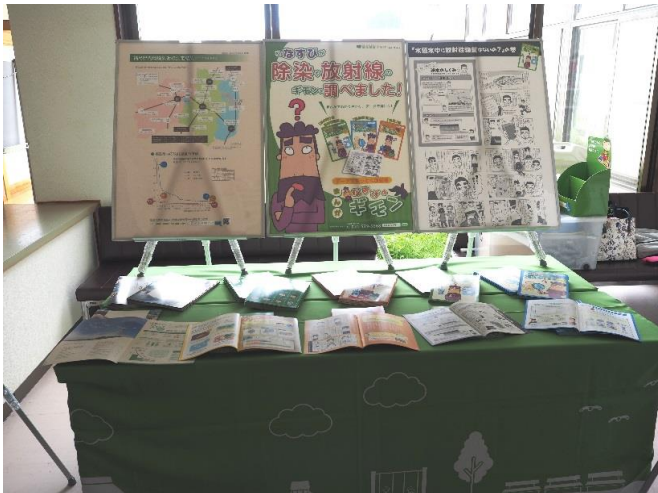
環境省除染情報プラザ 「私なすびが除染や放射線のギモンを調べました」