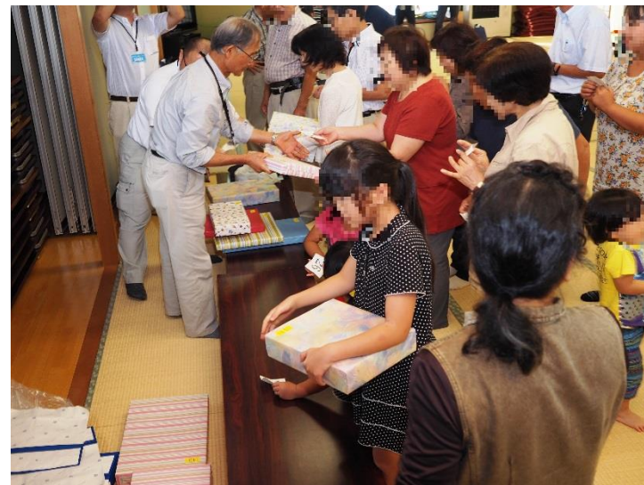
水環境(下水道)クイズ