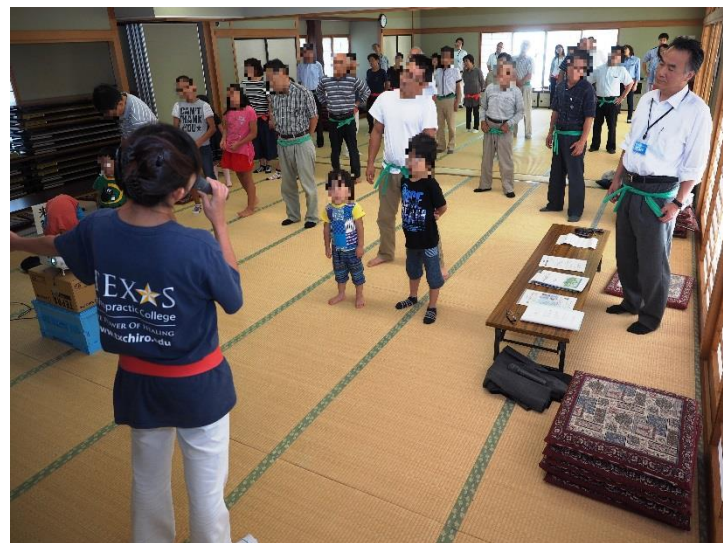
カイロプラクティックで健康な身体づくり ゴムバンド体操の様子