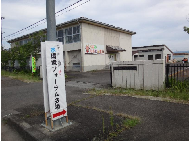
会場 国見町森江野町民センター