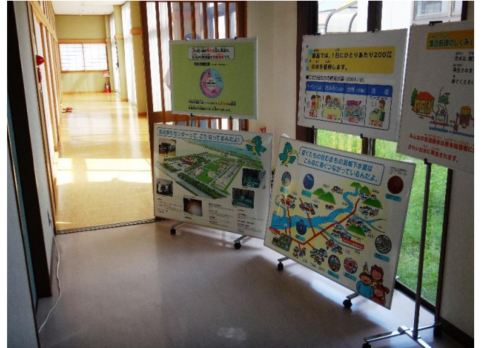
下水道公社「下水道の役目と流域下水道のしくみ」