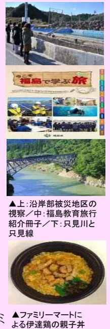
▲上：沿岸部被災地区の視察／中：福島教育旅行紹介冊子／下：只見川と只見線