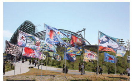
「小名浜国際環境芸術祭」