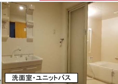
洗面室・ユニットバス