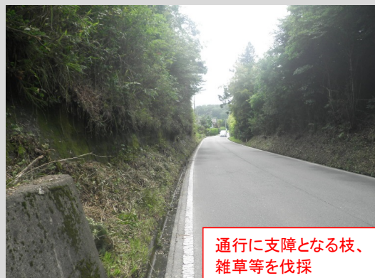
通行に支障となる枝、 雑草等を伐採