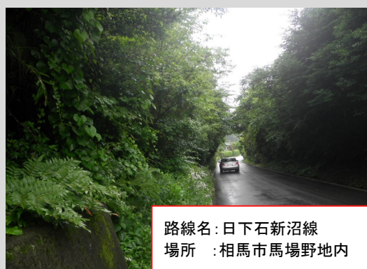
路線名：日下石新沼線 場所：相馬市馬場野地内