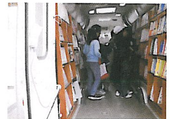
▲移動図書館車の小学生の利用の様子

平成19年度は、町内図書館ネットワーク事業が運用開始となり、物流便(本の配送システム)が整備され、これを活用した学校の図書館活用教育に図書館がその一翼を担っています。