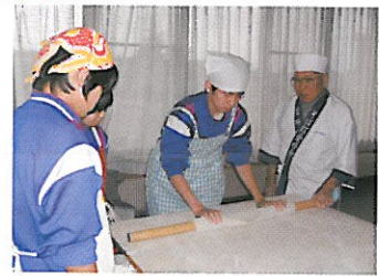
▲中学生そば打ち体験教室

磐梯町は良質なそばが栽培され、毎年そばまつりが開催されるなど県内でも有数のそば処であります。そこで、町の特産としての「そば打ち」の伝統技能を体験し、ふるさとの持つ食文化に興味と関心を深めることをねらいに、地元中学校の総合的な学習の時間に併せ、共催事業として毎年「そば打ち体験教室」を開催しています。