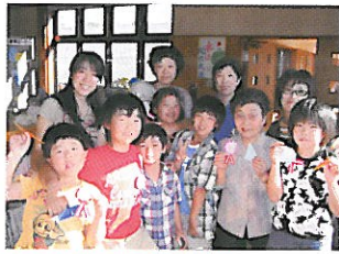
▲子どもの居場所づくり事業

町内には小学校が2校あり、それぞれ「ばんだい宝っ子教室」と「わくわく大谷っ子クラブ」と称して、現在は町の単独事業で子どもの居場所づくりに取り組んでいます。放課後、学校の施設を利用しスポーツ、文化活動など様々な体験活動を通して子ども達の豊かな心を