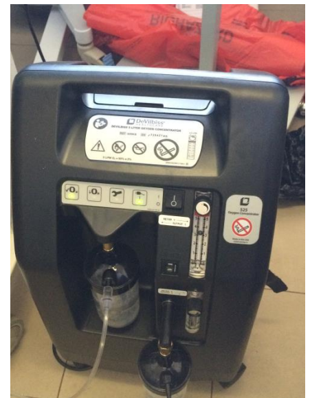
院内で稼働している酸素濃縮器

早速同僚とともに点検を始めた。外観は特に異常が見られない。そこで中を点検しようとカバーを外した瞬間、「汚ーい!!」と思わず日本語が出てしまった。それが下のこの写真。