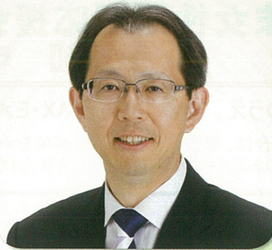
福島県知事 内堀 雅雄