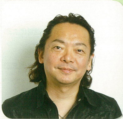
NPO法人ファザーリング・ジャパン ファウンダー／代表理事