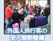
外国人旅行者の受入態勢整備