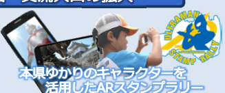
本県ゆかりのキャラクターを活用したARスタンプラリー