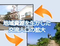
地域資源を生かした交流人口の拡大