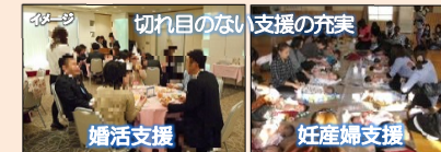
イメージ 切れ目のない