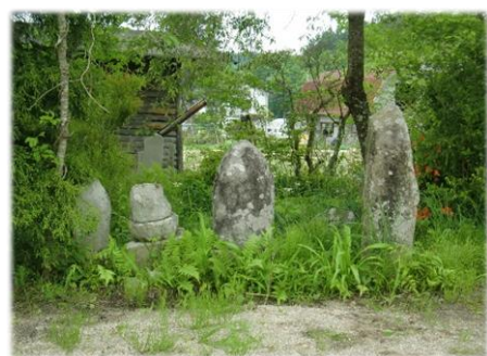
現在の早渡地蔵尊

早渡地蔵尊は、河川整備工事完了後、道路脇の見やすい場所に移設します。その際、地蔵尊を紹介する看板を設置します。