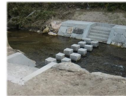
飛び石・階段の状況

今回は、その親水施設の整備状況と、早渡地蔵尊を案内する看板について、地元の皆さんと県、町の職員とで懇談を行いました。