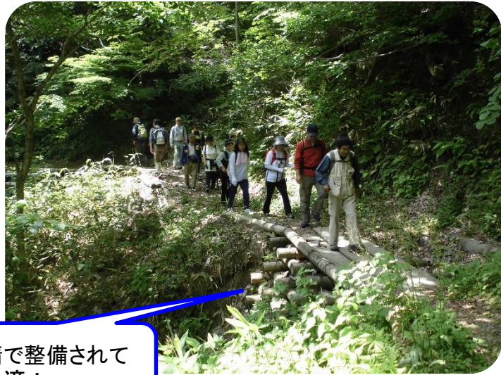
道普請で整備されて 歩行快適！