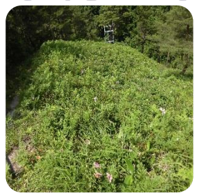
美しい「ヒメサユリ」 夏限定！！