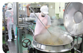
子どもたちのために手作りの給食

小学校では生産者と会食する「食と農の交流会」を実施していて、生産者から安全な作物であることや収穫の喜びについて話を聞き、給食と農業がつながっていることを学んでいます。