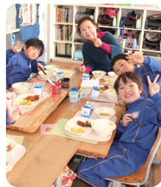
生産者と児童と一緒に給食

鮫川村の学校給食で使用する米や野菜などは、できるだけ地元の生産者が作ったものを優先して使用しています。鮫川村の農産物加工・直売所「手・まめ・館」と連携していて、地元の新鮮な野菜が届けられます。「手・まめ・館」には、かぼちゃのカットや里芋の皮むきなど下処理をお願いしていてとても助かっています。