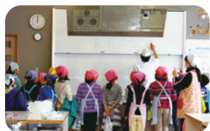
地産地消を学ぶ料理教室

地元の安全でおいしいものを食べて長生きする。震災があったからこそ、福島県が地産地消のモデルとなるべきなのではないでしょうか。