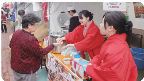
米粉を使った「華カレー」の販売

震災後、食材を集めるために生産者の家に直接行き、実際に食べてみたらものすごくおいしい野菜ばかりでした。これをホテルの食事に出したいと思い、平成23年の9月から地元の野菜を中心にした料理を始めました。季節にもよりますが、多いときには8割ぐらいの食材を地元の食材で賄 まかな っていて、オリジナルレシピの数は100を超えました。