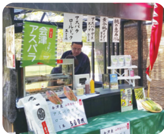
地元イベントに出店

「会津食の陣」などのイベントや6次化で地域を活性化させていきたいです。また、レシピ集の作成や料理セミナーを開催して、地元食材を活用する技を多くの人に知ってもらうことで、古くから伝わる食文化をしっかりと受け継いで次の世代に伝えていくことが大事です。誰が調理してもいい味が出せるようにしたいですね。