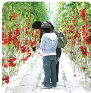
生産現場を実際に見学できる

震災後、いわき市が主催するキャラバンに参加し、東京などで農産物の安全性をPRしてきました。やっぱり、安全・安心であることを分かってもらうには、生産現場を実際に見て、その場で食べてもらうことが一番ですね。県内外の多くの方に見学に来ていただいています。少しでも風評の払拭や消費拡大につながればと思っています。