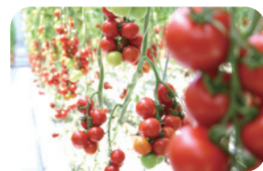
安全・安心・おいしいトマト