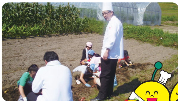
畑で実際に農業体験

他の旅館やホテルとの差別化を図るために、いわゆる旅館料理から脱却したい、他のホテルでは出せない料理を出したい、という気持ちがありました。そこで、地元の食材を活用した料理を作って出せないかと考えました。まずは、役場に行き、地元ならではの食材や郷土料理を聞いて回る中でたくさんの生産者の方と出会い、つながりができたのが今の活動に生きています。