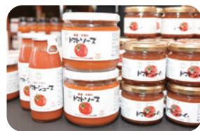
トマトのオリジナル商品

2月に新しい施設、ワンダーファームをオープンさせました。生産、加工、直売、飲食が体験でき、加工品のブランド化や農業体験学習の受け入れなど地域の皆さんや企業と連携して地産地消をより強化していきたいですね。