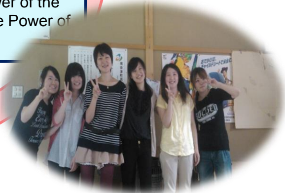
会津大学 日本人学生及び留学生 55名

Univ. of Aizu, Japanese and Intl. Students (55)