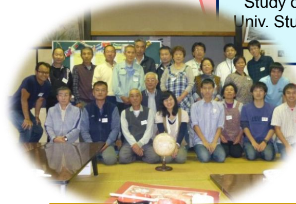
中小屋集落の皆さん(26名)

AY2012 – 2013 Subsidy of the Fukushima Prefectural Project “Field Study of the Local Community Revitalization with the Power of the Univ. Students” and AY2015 “Regional Development with the Power of the Univ. Students”