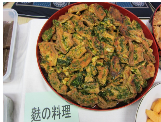
車麩の揚げ物(上谷地区)

西会津食のレシピ 集落の食文化も地域資源 として再認識 ⇒地域に存在する資源を 再確認&共有化