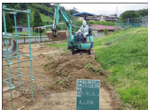
校庭除染工事表土剥取