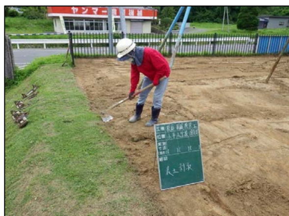
校庭除染工事表土剥取