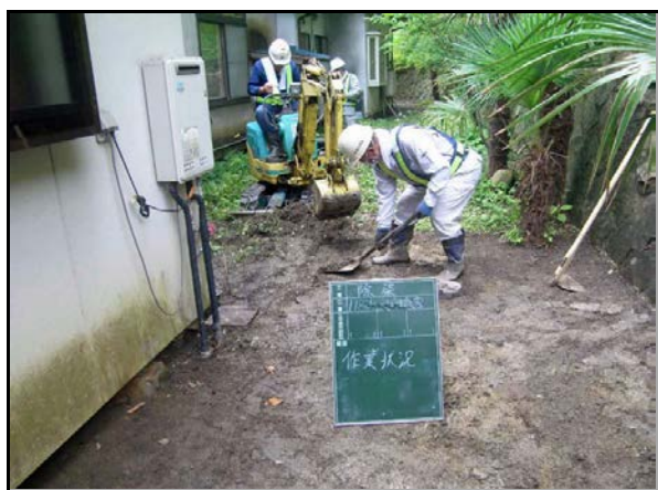
表土剥ぎ取り作業