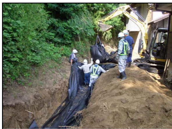
フレコン埋設作業