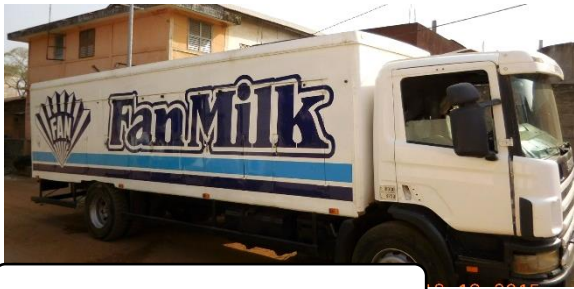
日本円で1つ10~100円くらい

ビスケットやスナックなど、日本と同じようなお菓子類も売っていますが、今回は、安くて美味しく、大人も子どももよく食べている、ベナンならではのおやつを紹介します。