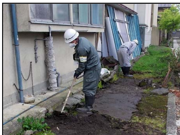
土壌剥ぎ取り作業