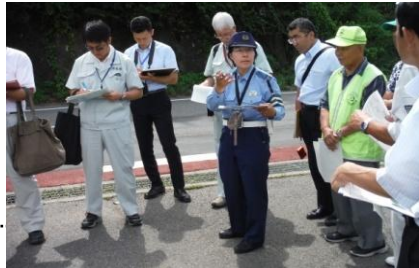
実施状況(イメージ)

合同点検 学校・警察・道路管理者の三者が合同で現地を点検、それぞれの立場で交通安全に必要な対策を話し合い、通学路の安全向上に努めます。