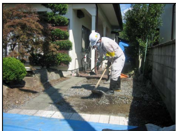
砂利・碎石の除去