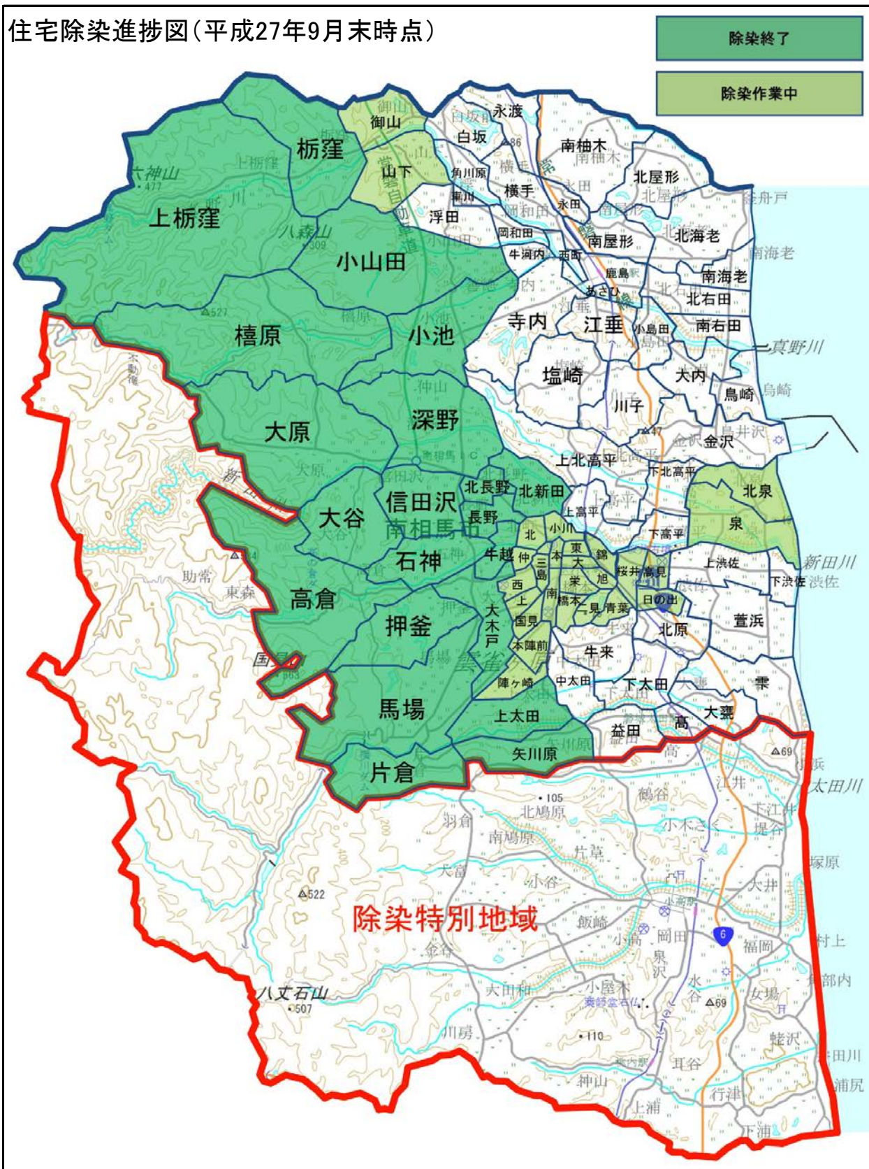
住宅除染進捗図(平成27年9月末時点)